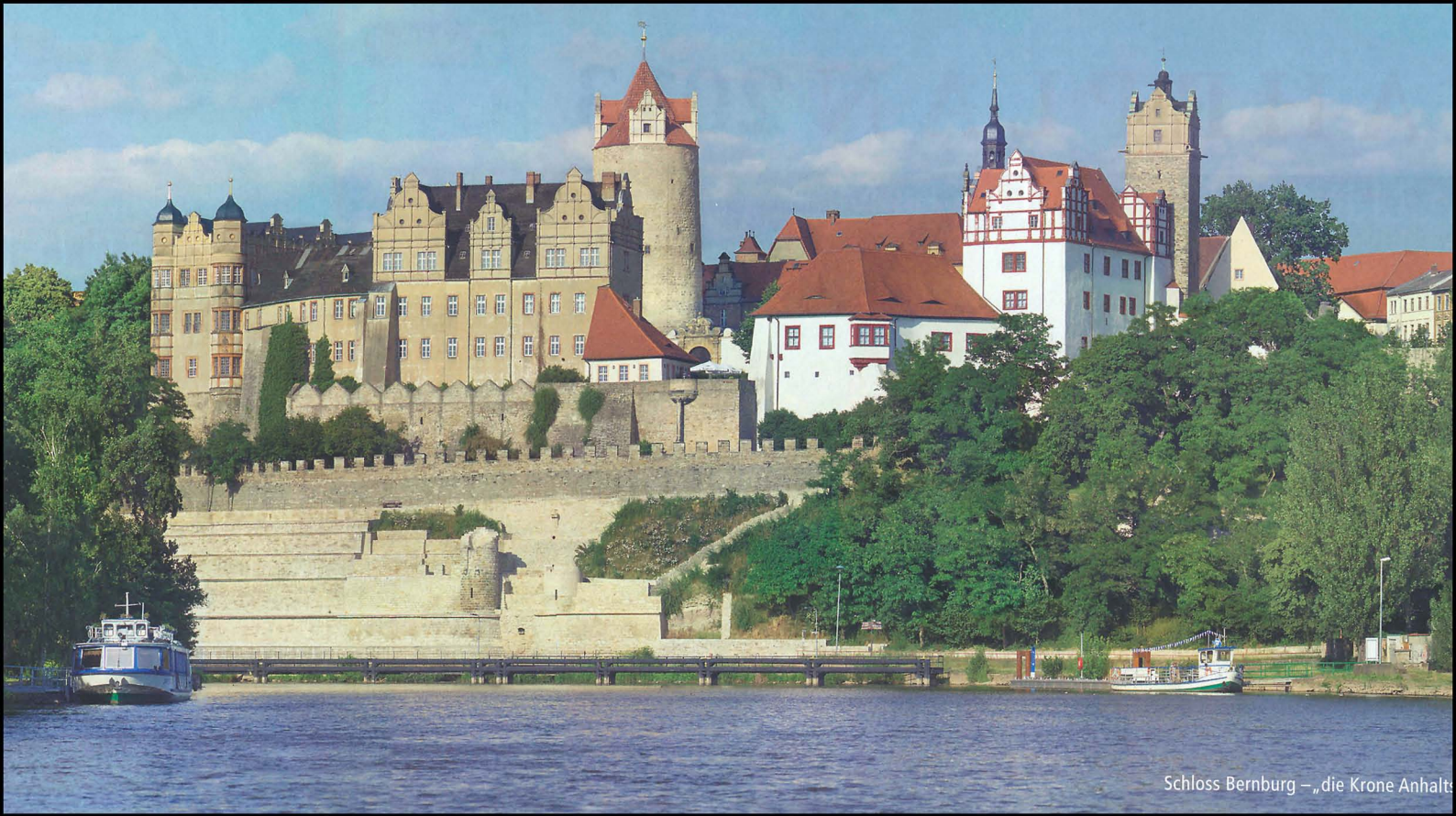
Schloss Bernburg – „die Krone Anhalts“